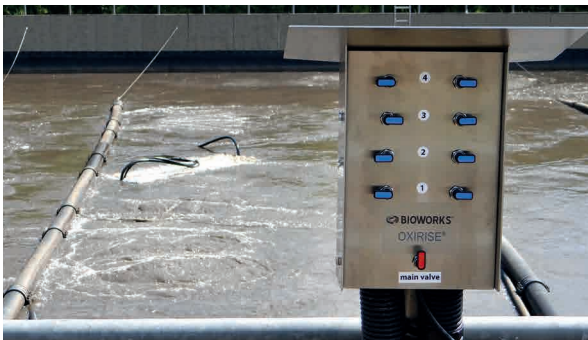
OXIRISE® in der Praxis

Der OXIWORKS® Belüfter ist ein Qualitätsprodukt „made in Germany“. Wir verwenden für OXIWORKS® Belüfter nur korrosionsbeständige Spezialkunststoffe mit hoher Temperaturbeständigkeit sowie hochwertigen Edelstahl. Die fein perforierten Belüftermembranen bestehen aus hochqualitativem Silikon.